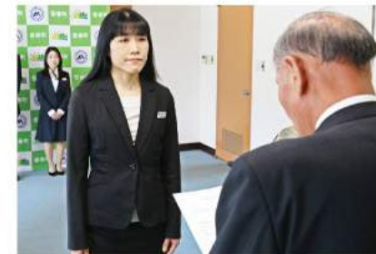
▲町長から辞令交付を受ける県職員(左)

5月1日、福岡県税務職員に町の税徴収業務の辞令交付が行われました。町職員と協力して滞納整理に携わるこの取り組みも今年で8年目