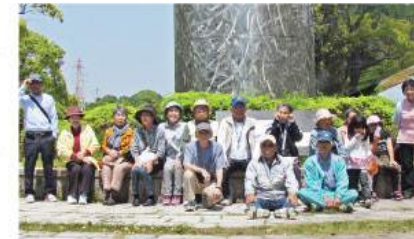
▲応援の人も参加して、大いに賑わいました

4月29日、福岡県身体障害者体育大会が博多の森陸上競技場で開催されました。香春町身体障害者福祉会から3人が陸上