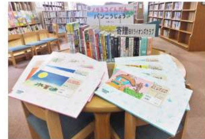
▲新しく購入した図書の数々

地域の青少年健全育成など、様々な社会奉仕活動を行っている田川ライオンズクラブから、児童図書購入費10万円が香春町へ寄付されました。