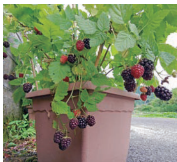
▲収穫期のボイセンベリー。育て易く、家庭菜園にも適しています。

そして7月に入ると晩生のブラックベリーが収穫期を迎えます。植物生理上、2年目のシュート(前年に地下から伸び出した茎)に実がつくので今年は少しの収量ですが、来年たくさんできることを期待しています。また、1.5年苗のブルーベリーは20株あり、まだ小さいので3年ほどは摘花(摘果)して木を気長に育てていきます。ゆくゆくは、動物がいてベリー狩りもできる複合型の循環農園を目指しています。