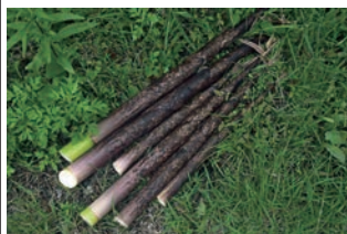
▲収穫した真竹です。孟宗竹の筍とは違いサクサクとした食感で美味しかったです。

今月は、久しぶりに人と対面して作業をし、人と触れ合う関係性の築きがどれだけ影響力が強いのかを再確認した1か月になりました！