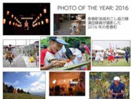
PHOTO OF THE YEAR. 2016