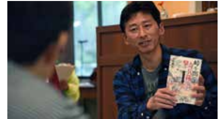
▲読んできた本や武将について各々の思いを話す「読書会」の参加者。

今後はテーマを「田舎での起業」、「農のある生活」など、「移住」にも関連付けて行こうと思います。