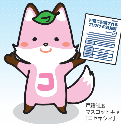
戸籍制度 マスコットキャラクター 「コセキツネ」