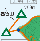
焼立山 (旧赤牟田ノ辻)