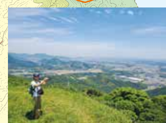
障子ヶ岳山頂からの眺望