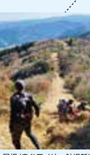
尾根 (赤牟田ノ辻～鮎返新道)