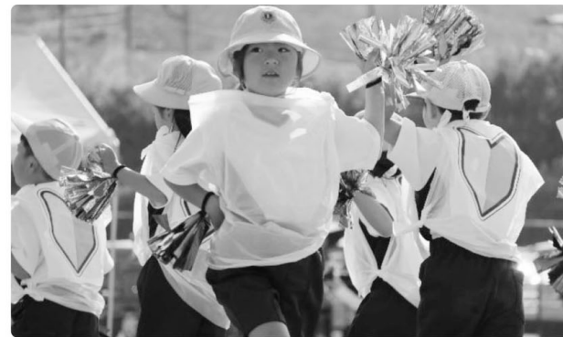
◁ 1年生表現 ピカピカのいちねんせい