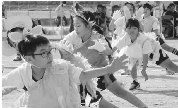
▷ 2年生表現 あつまれ！ピフケットの森