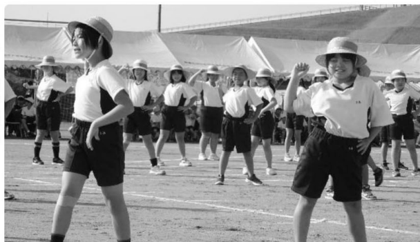
▷ 4年生表現 夏休みにできた笑顔