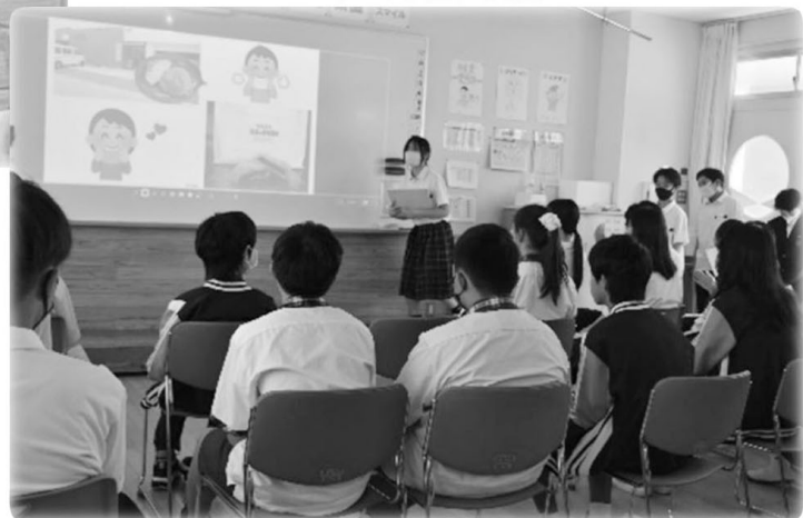
▽ 7年生と英語で交流