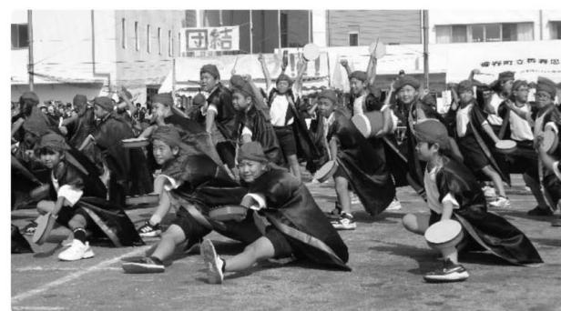
◁ 5年生表現 ダイナミック5年生