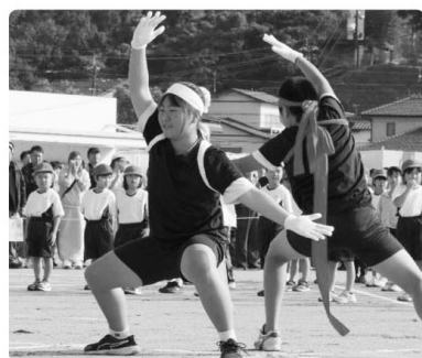
△ 応援団による演舞