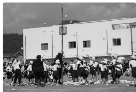
△ 低学年種目 玉入れ