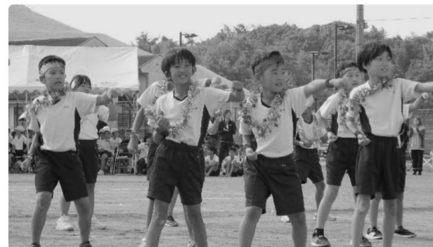
◁ 3年生表現 昭和100年☆ダンスメドレー