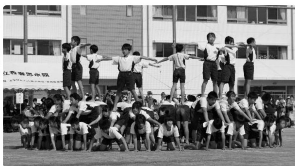
▷ 6年生表現 組体操♡心・技・体♡