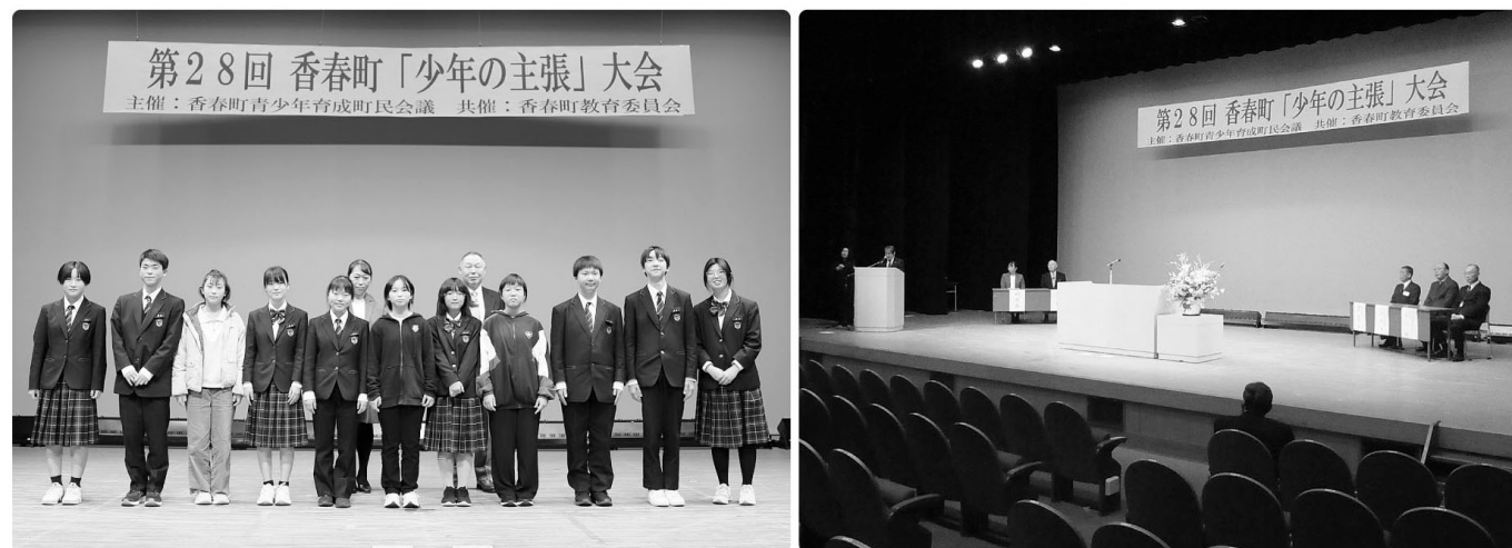
△ 昨年の様子 △

※最優秀発表者は令和8年2月15日(日)に福智町で開催される「少年の主張」田川地区大会の香春町代表に推薦いたします。