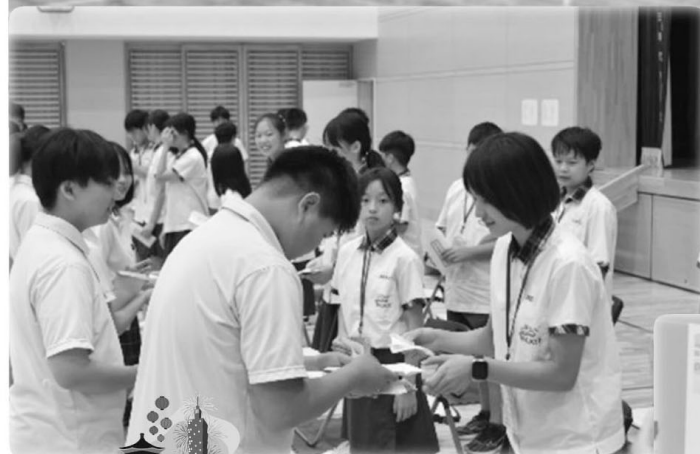
◁ 生徒会の代表と記念品の交換