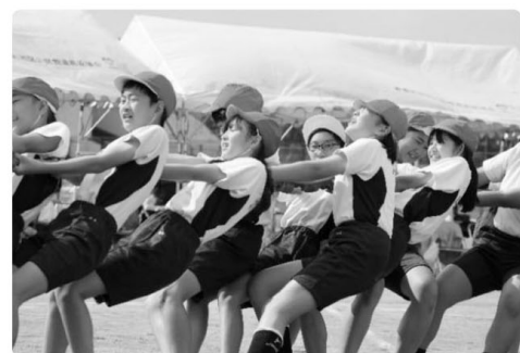
△ 高学年種目 綱引き