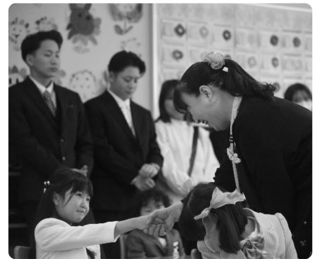
△よろしくお願いします!