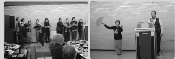
△ 会食時のカラオケや踊り △