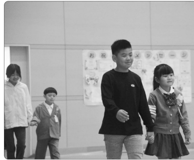
△6年生と一緒に入場

4月11日(金)に第5回入学式が行われ、ぴっかぴかの新1年生59名が香春思永館に入学してきました。6年生のお兄さんお姉さんに手を引かれ、新1年生が式場である体育館に入場してきたときは会場があたたかな雰囲気になりました。校長先生や来賓の方々のお話を聞き、元気づけたいのあいさつや返事ができていました。また、式の最後には在校生を代表して、6年生児童と後期課程の生徒会役員の出し物があり、