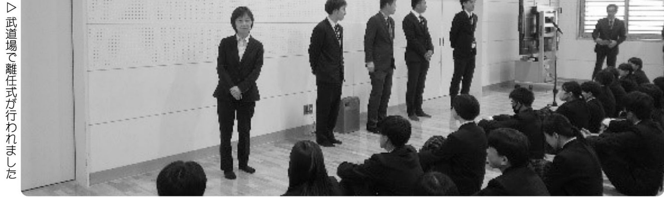
▷武道場で離任式が行われました

今年は三寒四温が続いて、桜が長い間咲いていました。4月8日(火)の始業式時にも、まだ花を残した状態でした。香春町もいよいよ春本番となったここ香春思永館で、1学期始業式が行われました。多くの離任の先生方とお別れをして、新しい学級に気持ちを新たにしながら、新しく赴任された先生方をお迎えしました。新7年生は新しい制服に身を包んで、緊張しながら全校児童生徒が一堂に会して、今年度の始業式に臨みました。毎年言っていますが、生徒・教師全員が「楽しい!」と思えるような学校づくりを、これから目指していきます。