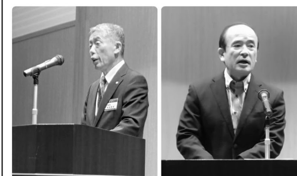
△ 町長あいさつ △ 理事長あいさつ

5月16日(金)、総会が開催され20名が出席。定数109名に対し、98名の承認を得て滞りなく議案が決議されました。 今年度も会員数の増加を目標にかかげ、スポーツ活動を通じて子どもたちの支援はもちろんながら、会員の皆さんが参加したくなるようなイベント等を行い、より一層地域の活性化を目指していきます。