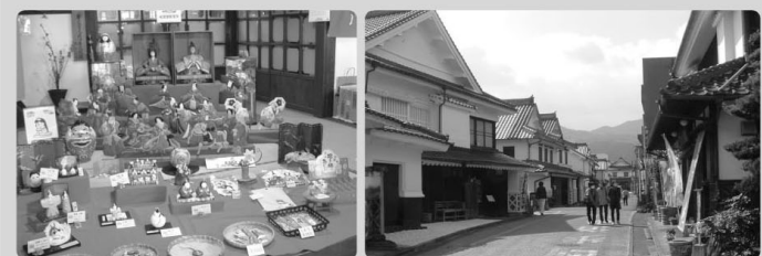
△ 吉井のお雛様めぐり △

歩こう会 (バスツアー) 3月17日(月)に参加者90名で、吉井町お雛様めぐりと筑後川温泉桑之屋での会食、帰りは道の駅原鶴バサロでお買い物をして、一日を楽しく過ごしました。