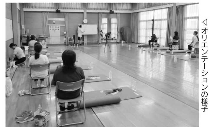
◀オリエンテーションの様子