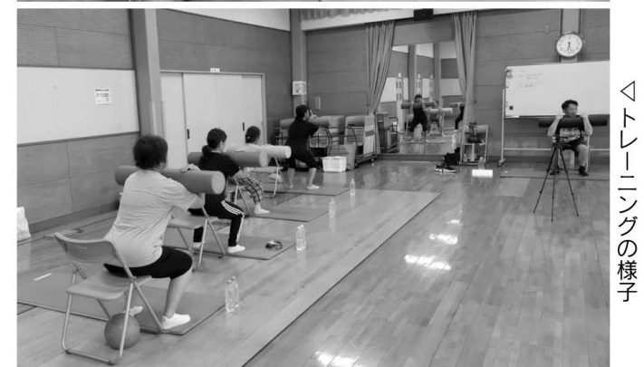
◀トレーニングの様子