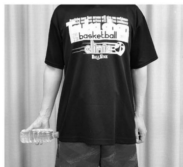
④親指を身体の外側へ向けてペットボトルを持つ