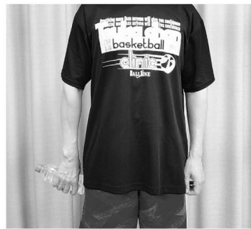
①小指を身体の外側へ向けてペットボトルを持つ