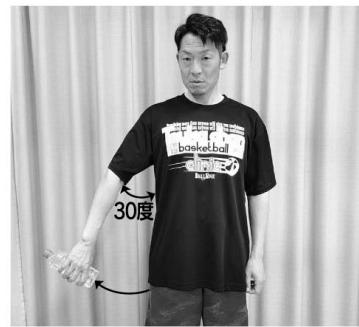
②腕を上げる角度は30度くらいでやや前方へ上げる