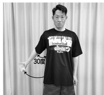
⑤腕を上げる角度は30度くらいでやや後方へ上げる