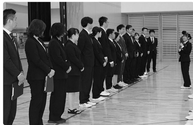
△赴任された先生方の紹介