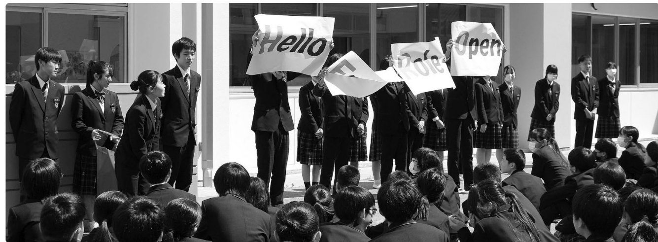
△生徒会スローガン発表の様子(後期)