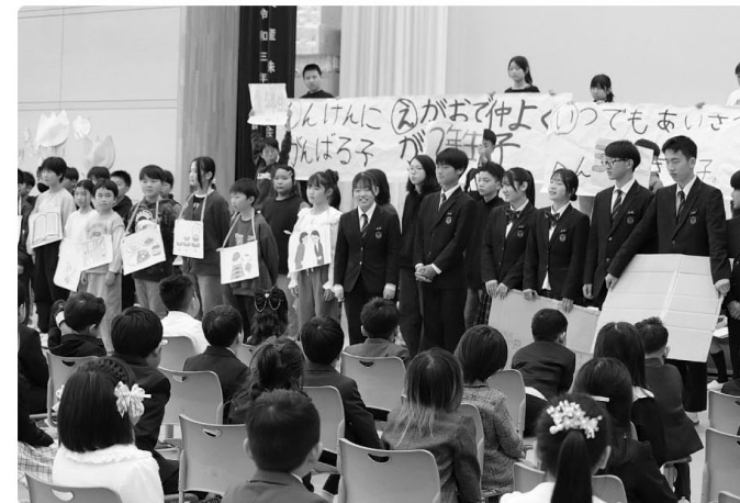
△6年生と生徒会からの歓迎の言葉