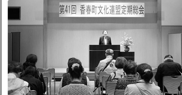
香春町文化連盟総会開催

5月9日(土)午前10時から、令和8年度香春町文化連盟総会を香春町町民センター・コンベンション室で開催いたしました。今年度はふくおか県芸術文化祭が香春町で開催されます。今年度も昨年引き続き会員皆様のご活躍を期待しております。町民の皆様におかれましては、9ページに文化連盟のサークルを掲載しておりますので、興味があるサークルにぜひ足を運んでいただきたいと思っております。お問い合わせをお待ちしています。