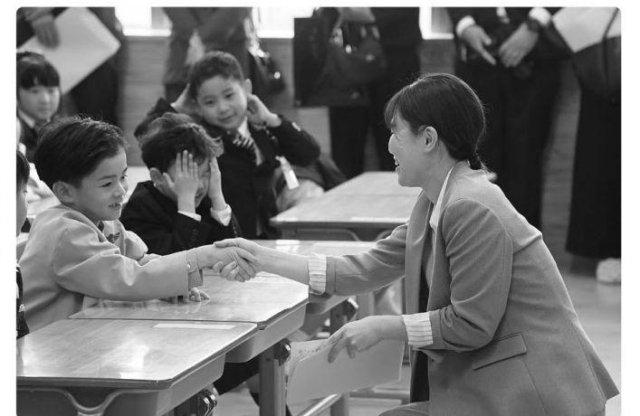
△よろしくお祈いします！