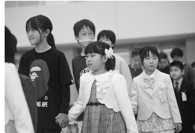
△6年生と一緒に入場

4月13日(月)に香春思永館の第6回入学式が行われ、新1年生67名が入学してきました。6年生のお兄さんお姉さんに手を引かれ、新1年生が式場に入場してくると会場があたたかな雰囲気になりました。 校長先生や来賓の方々のお話を聞き、元氣いっぱいのおあいさつや返事ができていました。 また、式の最後には在校生を代表して、6年生児童と後期課程の生徒会役員のお祝いの発表があり、新1年生のこどもたちは楽しそうな表情を浮かべ、学校生活への期待を膨らませていました。 教職員一同力を合わせて、新1年生の成長を見守り、支えていきたいと思っています。 地域の方々や保護者の皆様、いつも温かい見守りとご協力ありがとうございます。今後とも、香春思永館のこどもたちをよろしくお願いいたします。