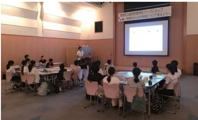
パワーポイントを使った計画の説明