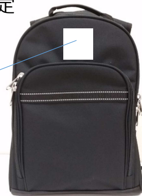
▲採用された後期課程の通学用カバン

指定物品の今後の協議事項：体操服・体育館シューズの検討 を年度内に行います。引き続き、各分野の協議事項について随時、進捗をお知らせしてまいります。