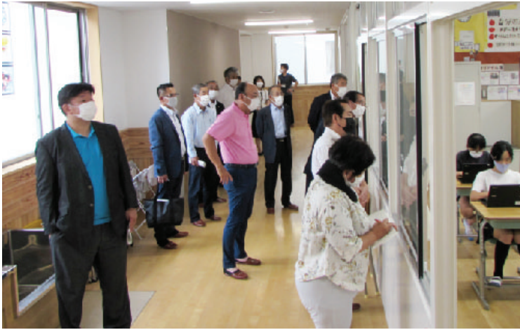
コロナ禍のため廊下から授業を視察