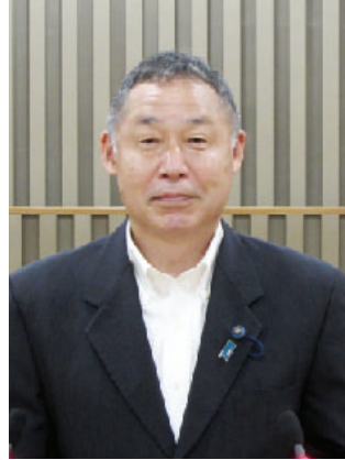
村上 寿利 (元)議員 むらかみ ひさとし