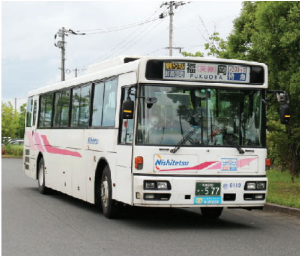
天神から県立大学（田川市）まで 運行中の西鉄特急バス