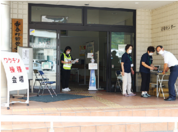
ワクチン接種会場（研修センターなごみの杜）