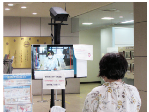
役場口ビーに設置されたサーマルカメラ

感染症対策用品の購入費を補助 1店舗5万円を上限（40件分） 申請期限は令和3年9月30日まで 店舗をはじめ、学習塾や宿泊施設、施術所などで感染症対策のために対象物品を購入した経費の4/5を1回限りで補助する。詳しくは、産業振興課（☎32-8406）