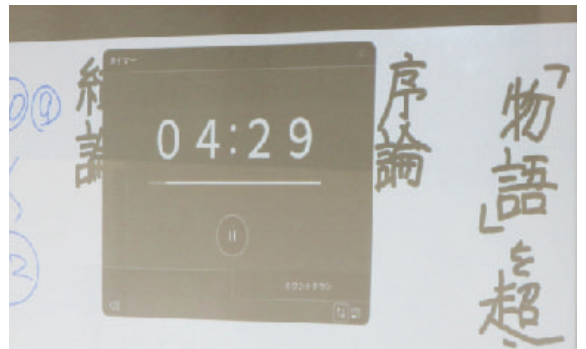
解答時間を意識させるタイマー機能