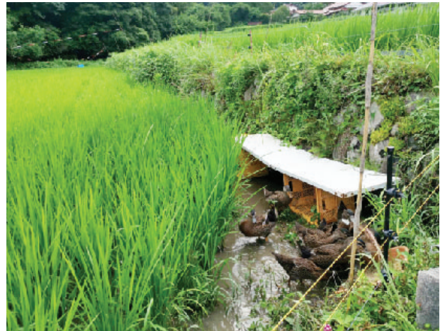
アイガモ農法で米づくり

答 町、認定農業者、JA、商工会、地域おこし協力隊、民泊等の宿泊先などで構成する協議会を計画。