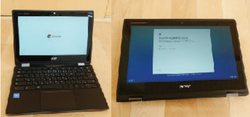
1人1台のタブレット