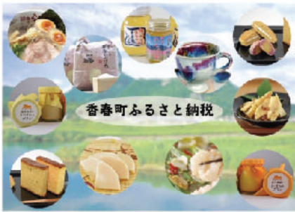
香春町ふるさと納税