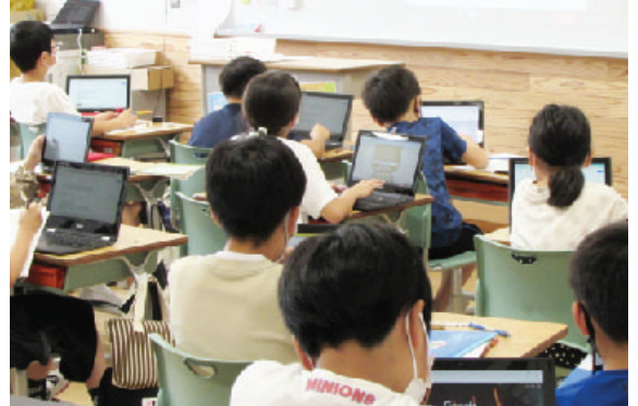
1人1台タブレットを活用

7月9日（金）に1人1台のタブレットや電子黒板など、ICTを活用した授業を視察しました。