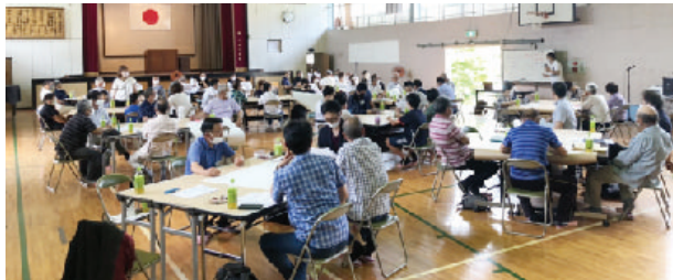
採銅所地域運営組織準備会

答 國安まちづくり課長 採銅所小学校は、地域 に根差した複合施設とし て計画している。地域運 営組織と町が推進し、今 年度中の取りまとめを目 指す。