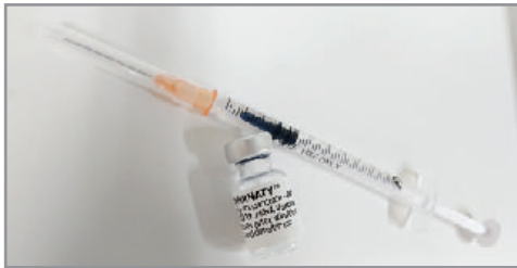
ファイザー社製ワクチン

答 進保健康課長 対象者の約20%の方の意思確認が取れていない。可能な範囲で調査し、案内を行っていく。