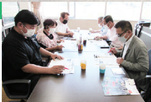
編集中の広報委員会

今号から2年間、このメンバーで議会だよりを編集します。町民の皆さんに知って欲しいこと、皆さんが知りたいことなど、町の魅力や課題を共有できるように「読みやすい・分かりやすい」紙面を作っていきたいと思います。「町民の声」もお聞かせください。