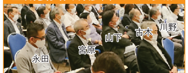
令和3年7月16日（福岡市）