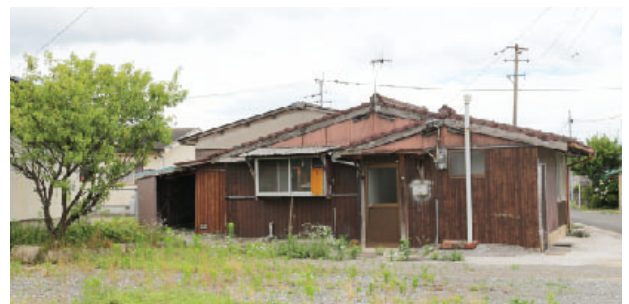
老朽化した一本松団地