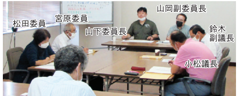
議会活性化検討委員会で商工会と意見交換