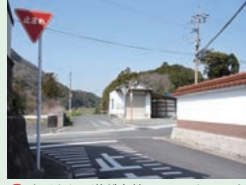
7 たくさんの道が交差しているよ。しっかり左右を確認してから渡ろう。