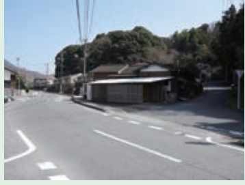
20 たくさんの車がスピードを出して通るよ。しっかり左右を確認して渡ろう。