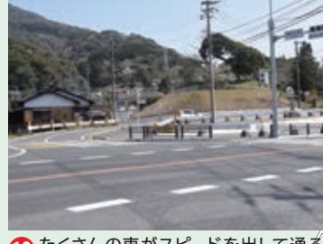
12 たくさんの車がスピードを出して通るよ。気をつけて渡ろう。