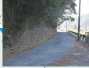
5 人通りが少ないよ。一人歩きはやめよう。