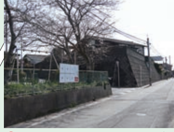
18 左の道から出てくる車に注意しながら通ろう。