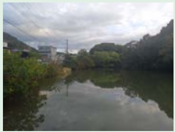
16 落ちたら危険!身を乗り出したり、釣りをしたりしないようにしましょう。