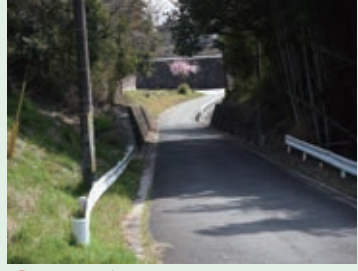
19 人通りが少ないよ。一人歩きはやめよう。