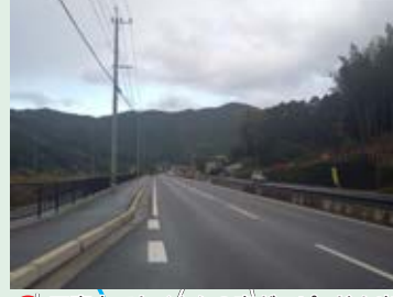
2 工事中でたくさんの車がスピードを出しているから気をつけて通行しよう。