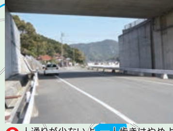
3 人通りが少ないよ。一人歩きはやめよう。