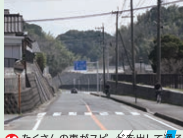
13 たくさんの車がスピードを出して通るよ。横断歩道で止まってくれないことが多いから、気をつけて渡ろう。