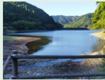
1 落ちたら危険!子どもだけでは絶対近寄らないようにしましょう。

この地域安全マップは、子どもたちが安全に過ごすことができるように、また、地域のみなさんへ防犯や交通安全への呼びかけを願って作成されました。防犯や交通安全には、地域のみなさんの日ごろからの注意がとて大切です。みなさんのご協力で、安全・安心なまちづくりをしていきましょう。