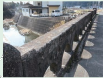
6 落ちたら危険!手すりや橋から身を乗り出さないようにしましょう。