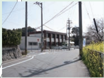
15 左の道から出てくる車に注意しながら通ろう。