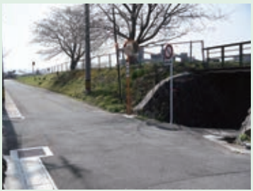
17 高架下から道にでるときは、必ず左右を確認し、曲がってくる自転車にも注意しよう。人通りも少ないから一人歩きはやめよう。