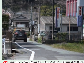
10 せまい道だけど、たくさんの車が通るよ。気をつけて通ろう。