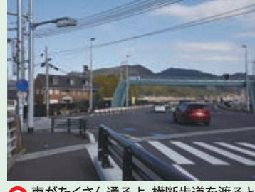
8 車がたくさん通るよ。横断歩道を渡るときは、青信号でも注意して渡ろう。