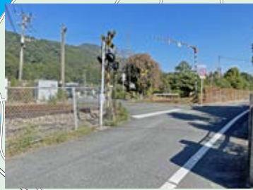
14 踏切は左右を確認して、車にも注意して渡ろう。