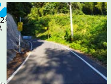
21 前に不審者が出てくるよ!人通りが少ないから一人歩きはやめよう。