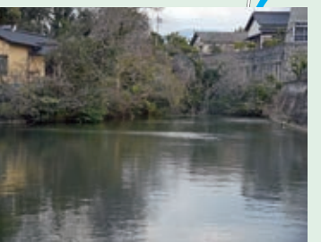
24 落ちたら危険!身を乗り出したり、釣りをしたりしないようにしましょう。