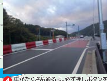
4 車がたくさん通るよ。必ず押しボタンを押して、信号が青になってから渡ろう。