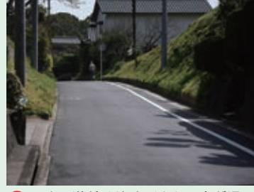
11 せまい道だけど、たくさんの車が通るよ。気をつけて通ろう。