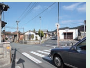
22 5本の道が交わる交差点。たくさんの車がスピードを出して通るよ。しっかり左右を確認して渡ろう。