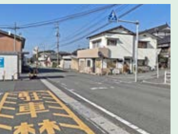
23 駅やスーパーがあって、車が多く通るよ。しっかり左右を確認して渡ろう。