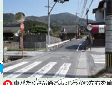
9 車がたくさん通るよ。しっかり左右を確認して渡ろう。また、雨が降ると溝の水かさが増えるから気をつけよう。