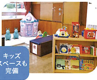
キッズ スペースも 完備